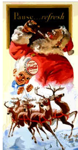
Publicité pour Coca-Cola®