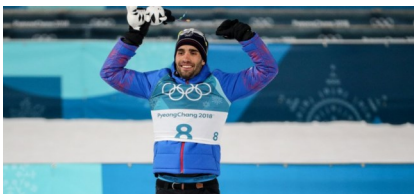
Le voici en photo lors des JO de 2018

Pendant les JO 2018 Il a 4 médailles d'or au biathlon .